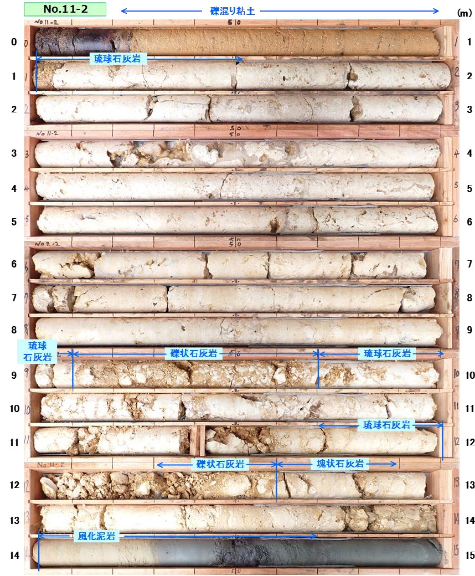
図 3.1.10(1) コア写真：No.11-2