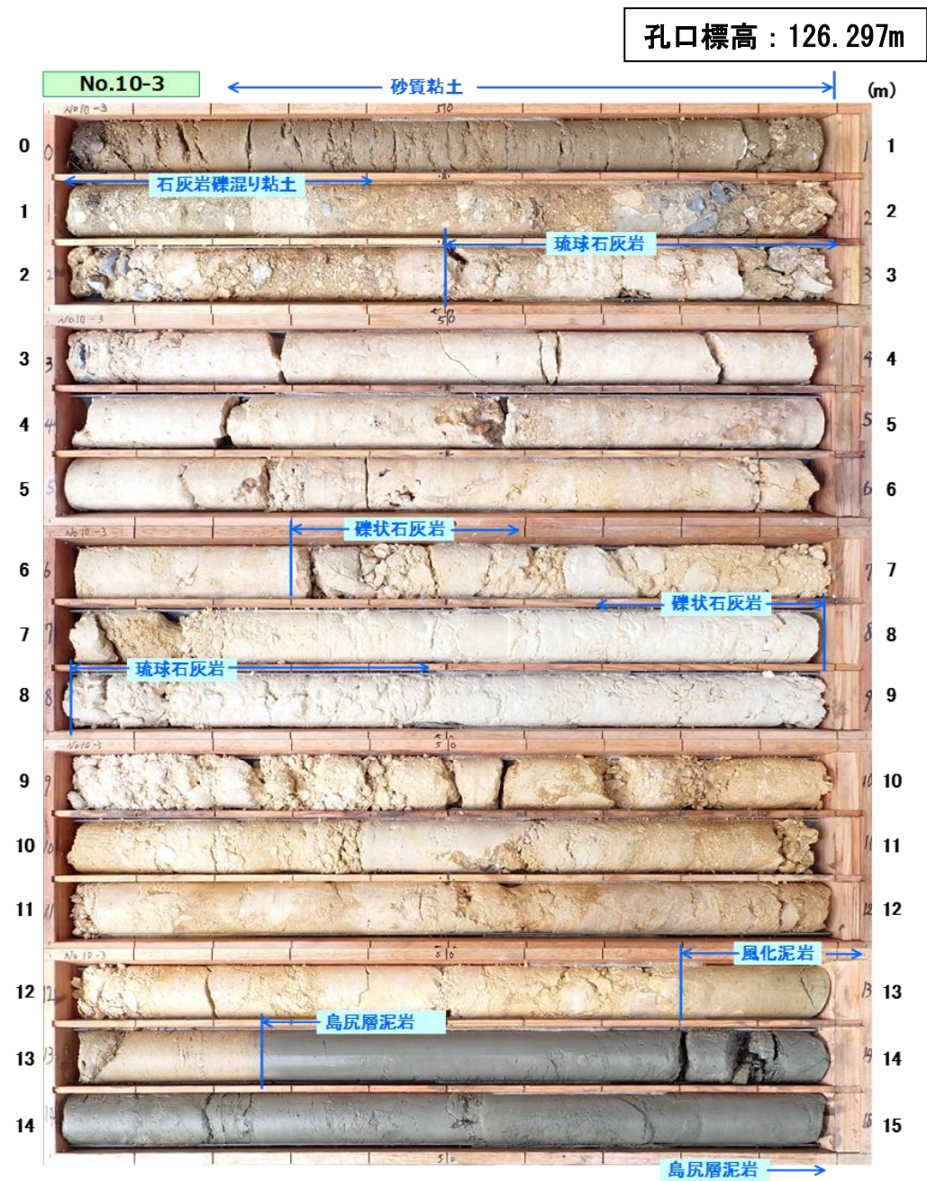
図 3.1.8(1) コア写真：No. 10-3