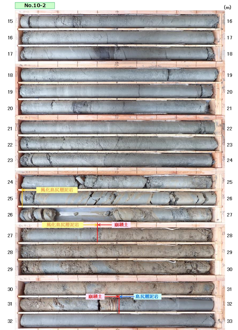
図 3.1.7(2) コア写真 : No. 10-2