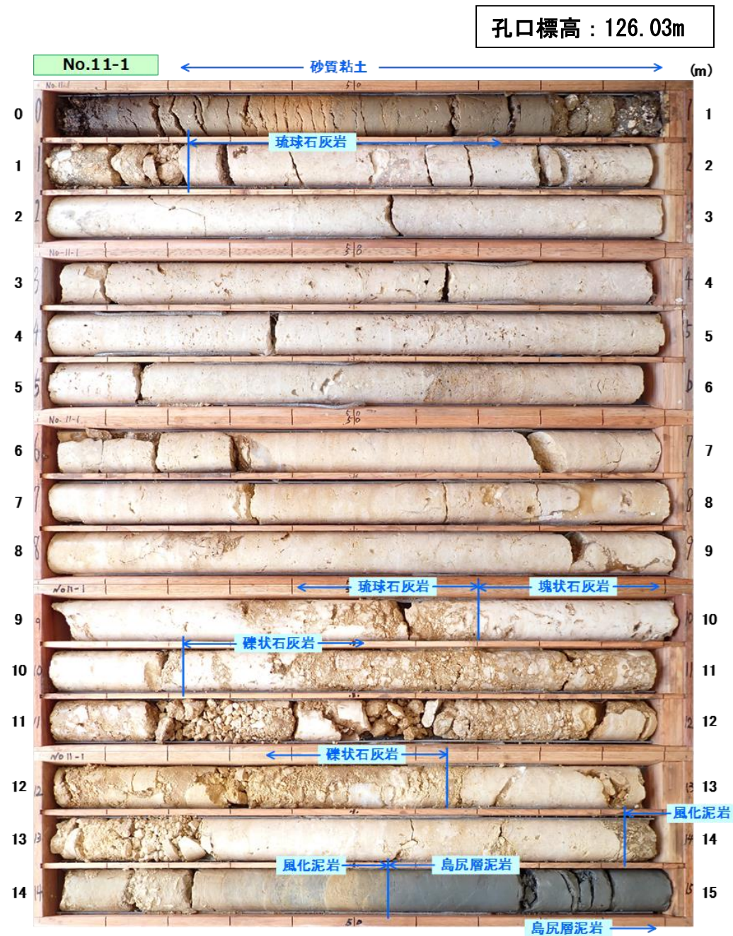
図 3.1.9(1) コア写真：No. 11-1