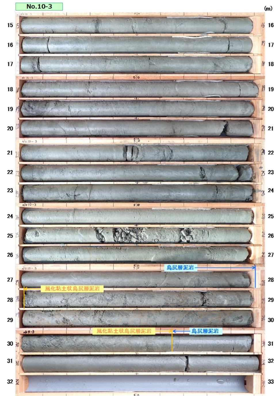
図 3.1.8(2) コア写真：No. 10-3