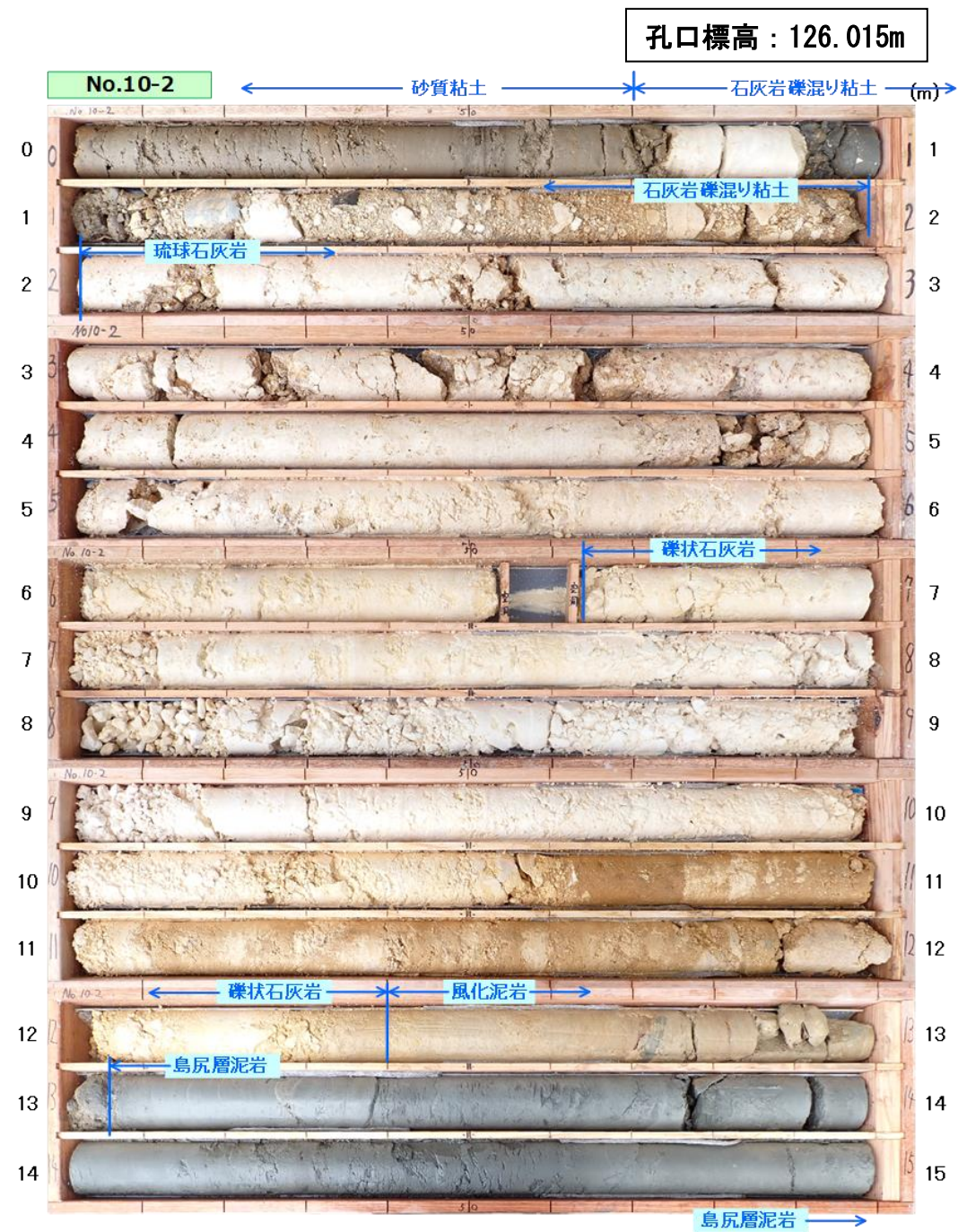
図 3.1.7(1) コア写真 : No. 10-2