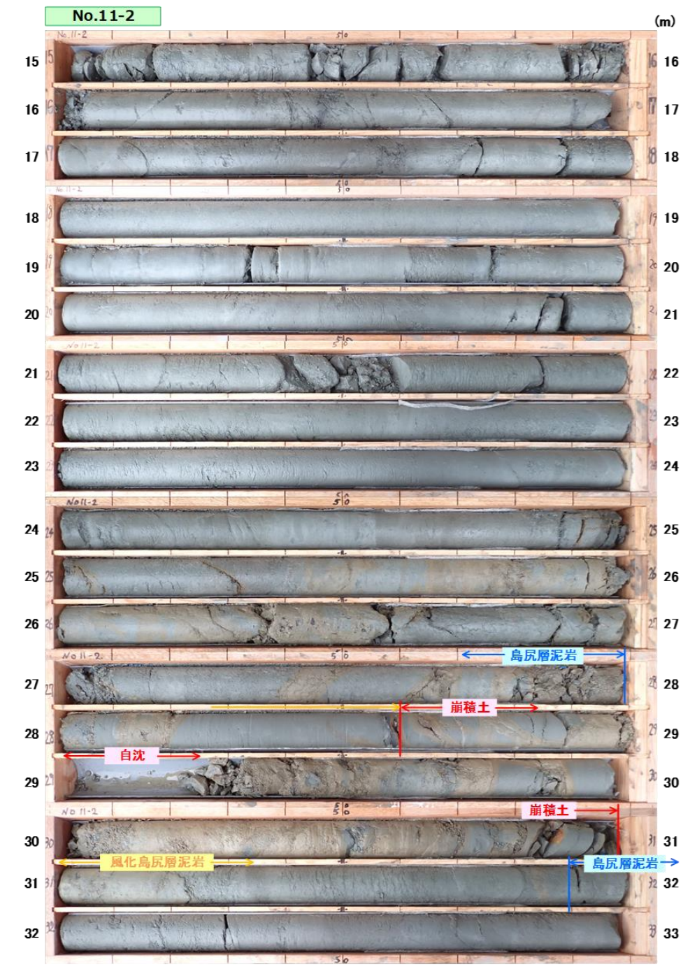
図 3.1.10(2) コア写真：No.11-2