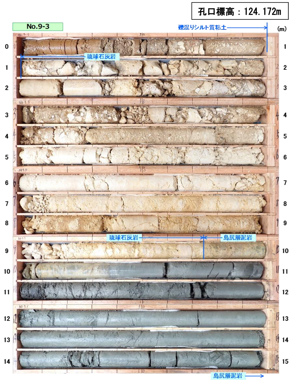
図 3.1.4(1) コア写真：No. 9-3