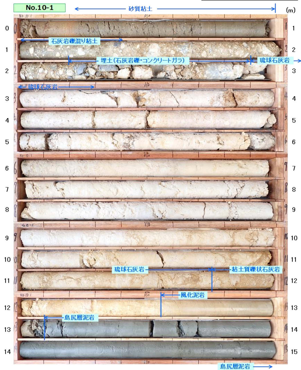
図 3.1.6(1) コア写真：No. 10-1