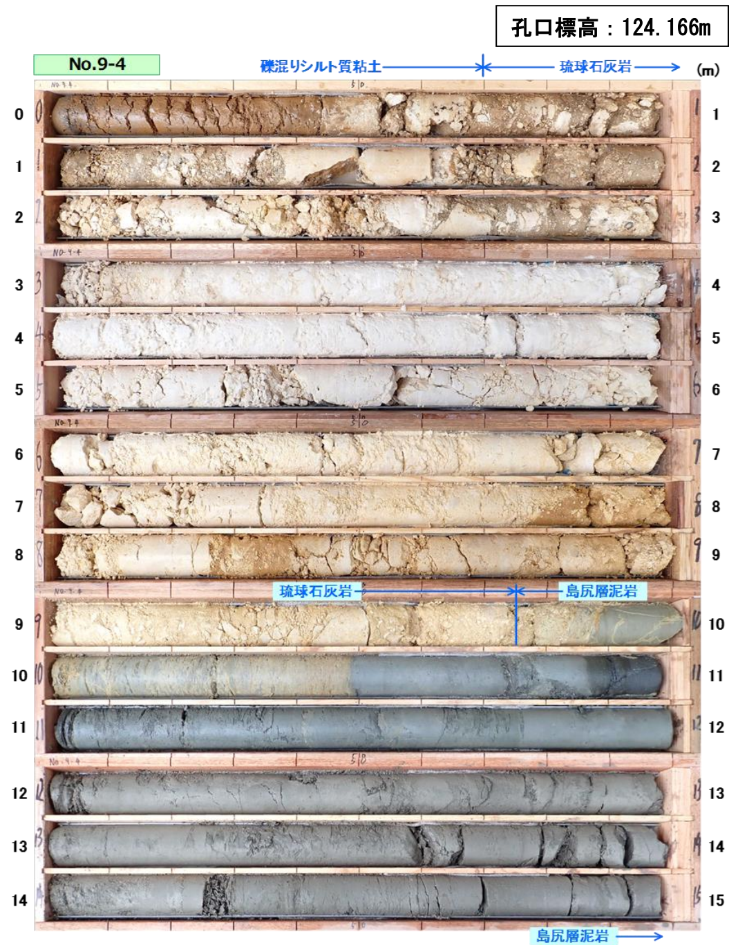
図 3.1.5(1) コア写真：No.9-4