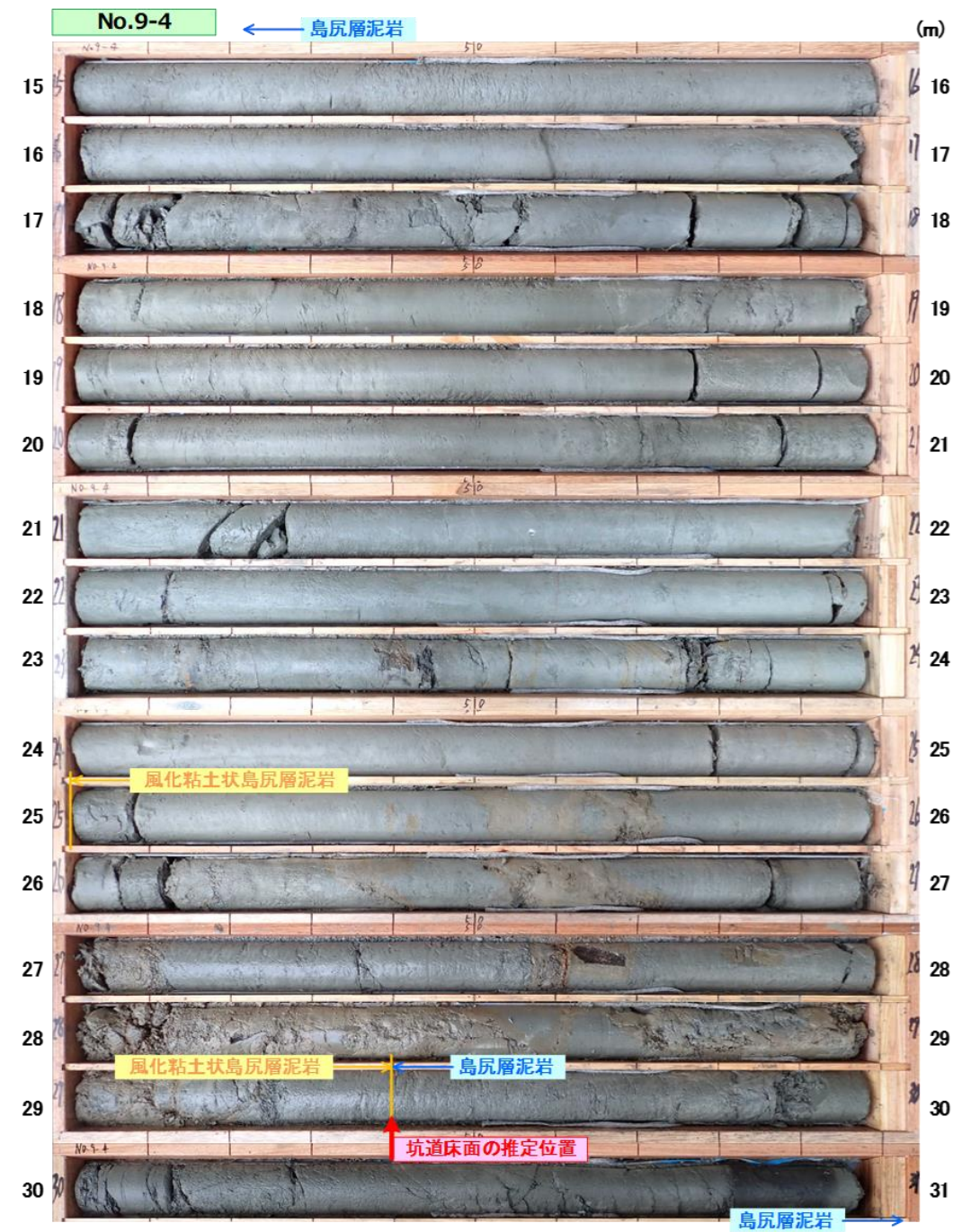
図 3.1.5(2) コア写真：No.9-4