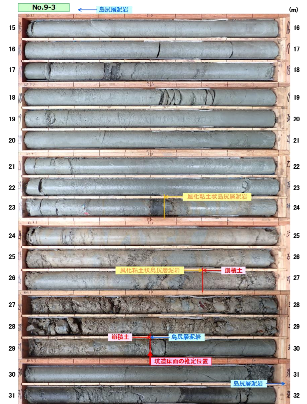
図 3.1.4(2) コア写真：No. 9-3