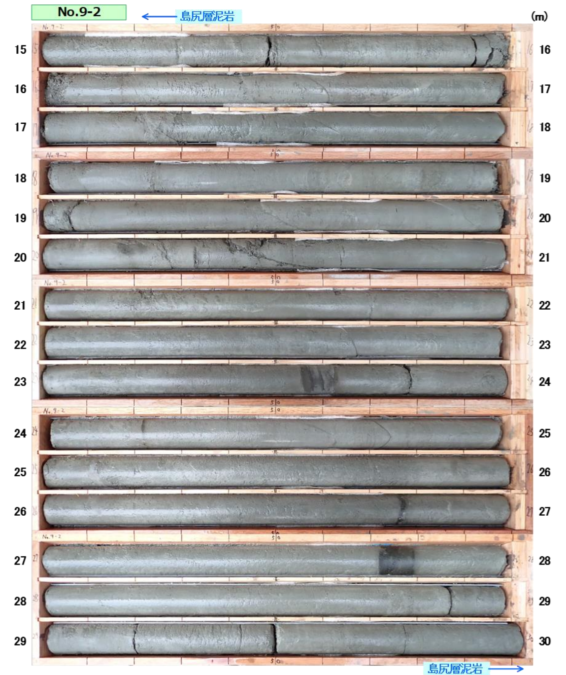
図 3.1.3(2) コア写真 : No. 9-2