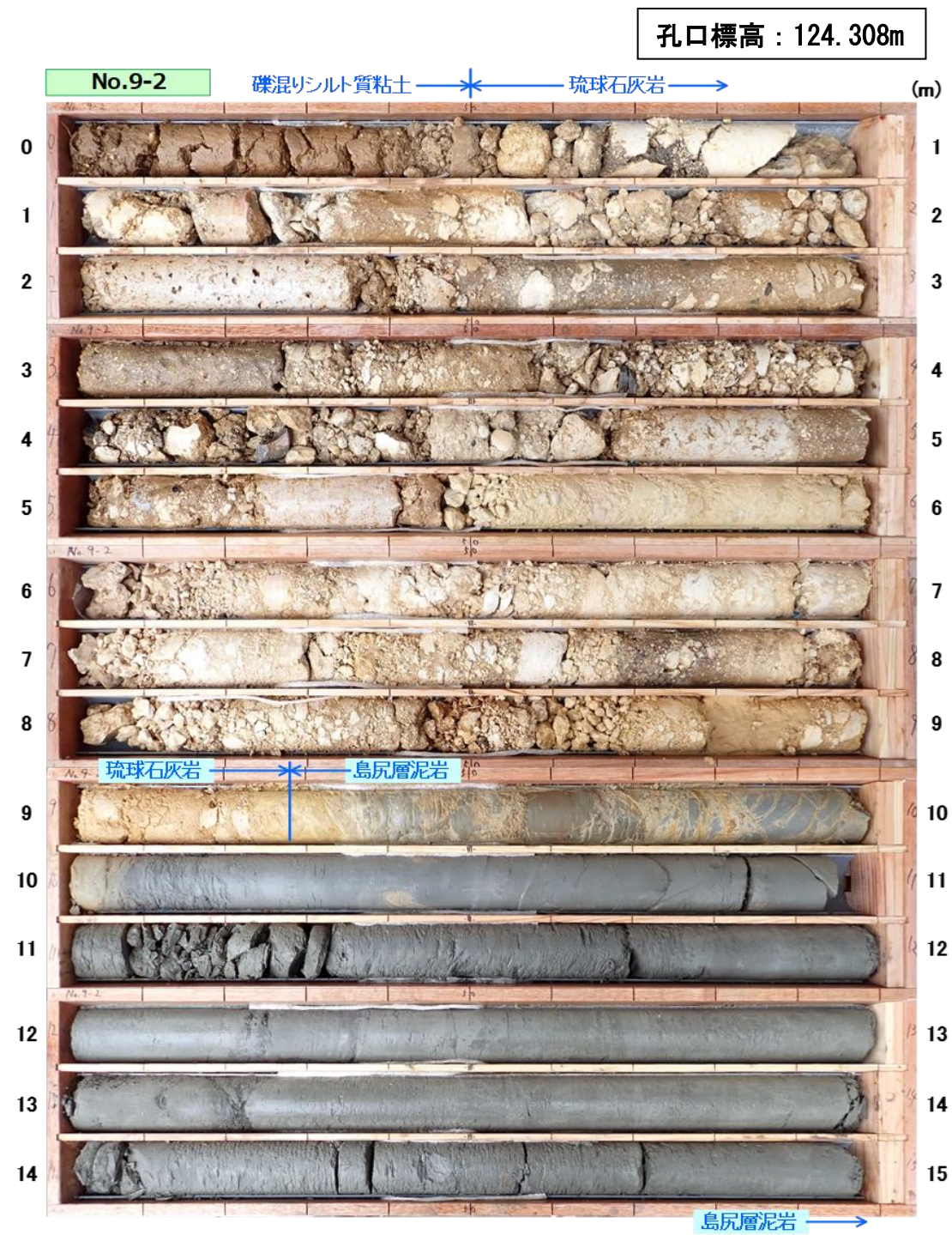
図 3.1.3(1) コア写真 : No. 9-2